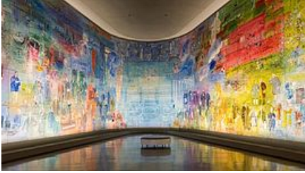
La Fée Électricité de Raoul Dufy