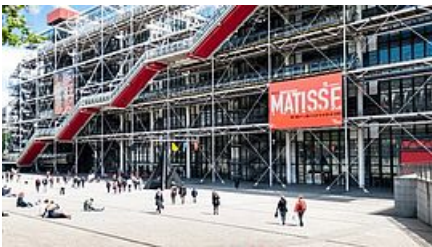
Centre Pompidou à Paris

Rendez-vous sur Youtube pour voir la vidéo sur le vol de la Joconde .