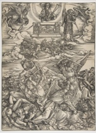
Albrecht Dürer (Nüremberg, 1471 id. 1528) Les quatre anges de l'Euphrate pour l'album l'Apocalypse, 1498 gravure sur bois de fil du papier vergé 39,7x28,2 cm (trait carré) ; 39,7x28,2 Cm (feuille) Musée de Gravelines