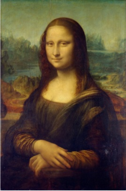
Portrait de Lisa Gherardini, épouse de Francesco del Giocondo dite Mona Lisa la Gioconda ou la Joconde Léonard de Vinci (Vinci, 1452 Amboise 1519) vers 1503-1519 Peinture sur Bois H. 0.77 m L. 0.53 m