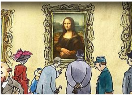
Le Petit Louvre © Le Petit Louvre