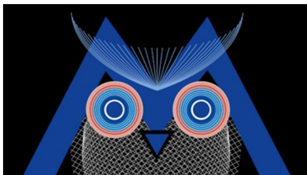
La 16e Nuit Européenne des musées

Toutes les infos sur nuitdesmusees.culture.gouv.fr