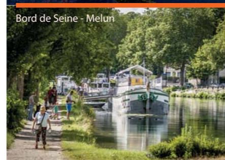
Bord de Seine - Melun