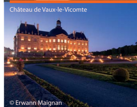
Château de Vaux-le-Vicomte