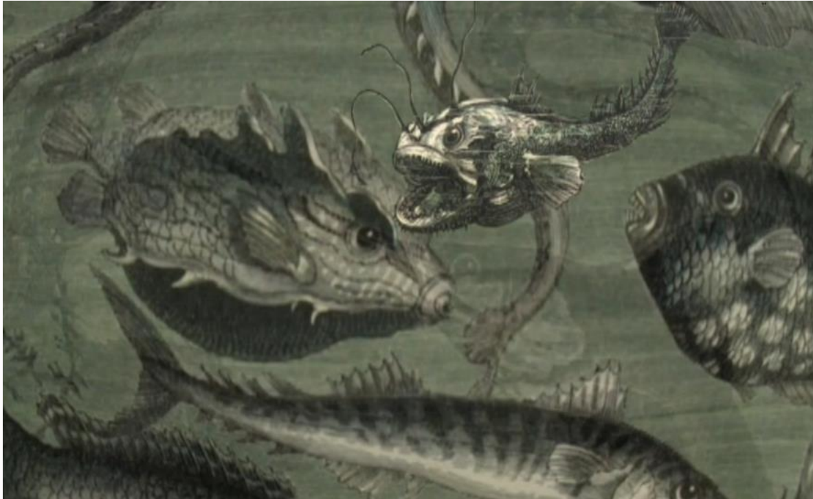
De la Terre à la Lune (série Les Voyages extraordinaires de Jules Verne) François Demerliac, Jean Demerliac. Musique : Michel Musseau. Virtuel productions/Musée de Jules Verne de Nantes/universciences