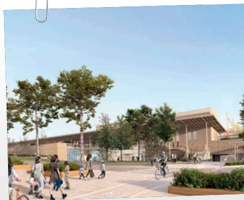
Le futur pôle gare de Melun, à l'horizon 2030