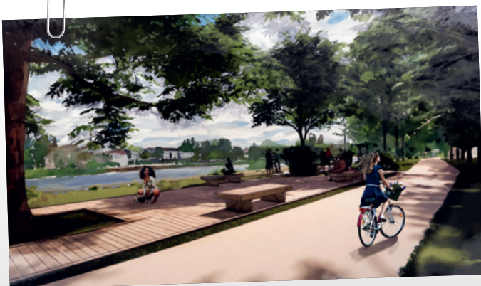
Des liaisons douces pour profiter des bords de Seine