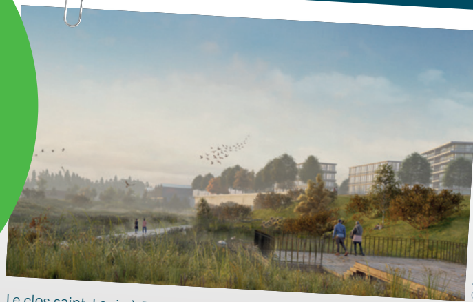
Le clos saint-Louis à Dammarie-lès-Lys, tout un quartier à réinventer

Une vision d'avenir, un territoire en devenir